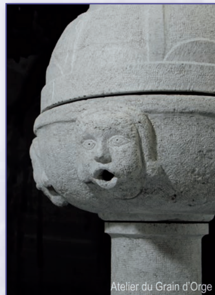
Atelier du Grain d'Orge